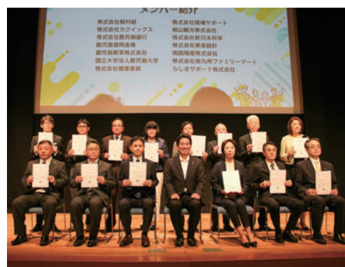
発足式では、下鶴市長より参画証が授与されました