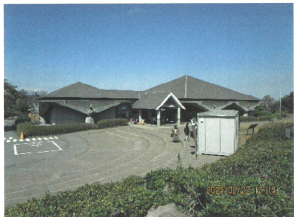
桜島ビジターセンター