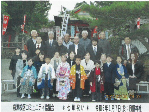
校区合同七草祝い