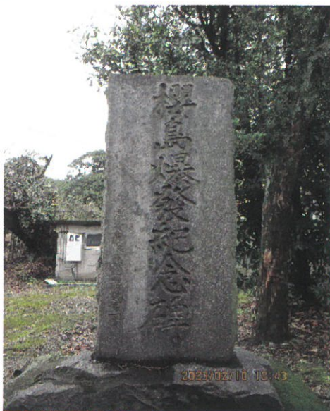
桜島爆発記念碑（桜島小池町）