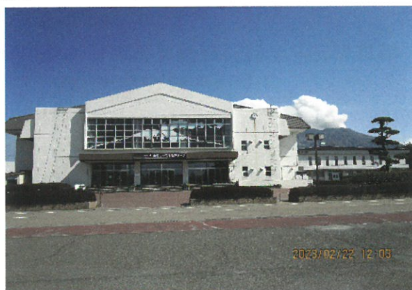
南栄リース桜島アリーナ