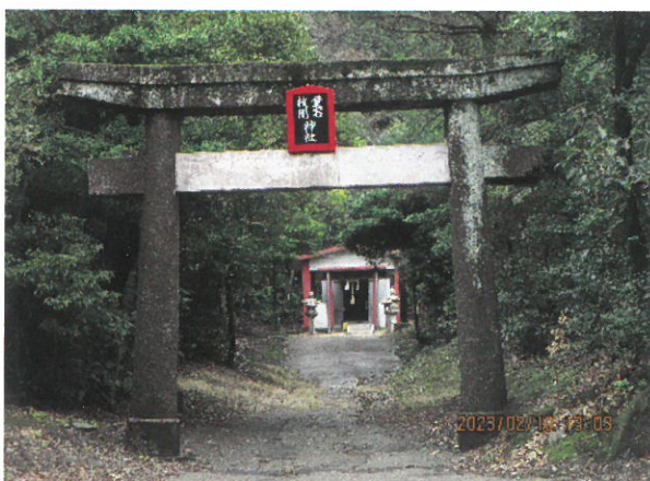
愛宕枚聞神社（赤水地域）