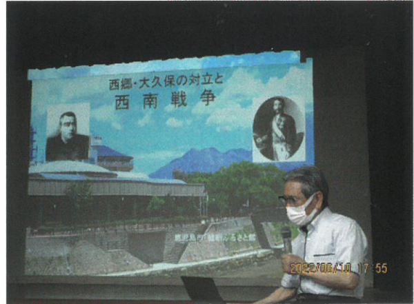
成人・女性学級（明治維新期の薩摩）