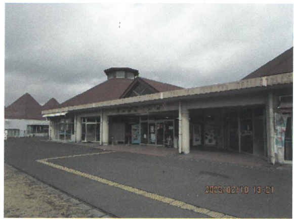
道の駅「桜島」火の島めぐみ館