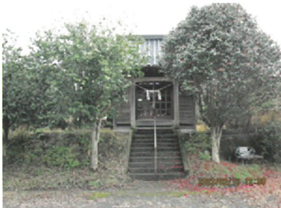
尾地底神社（赤生原地域）