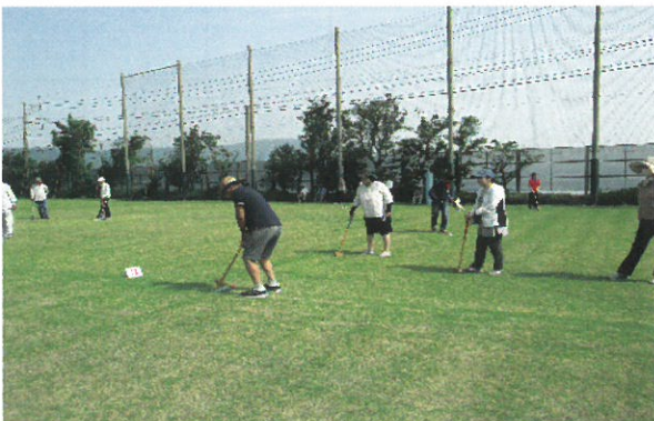
桜洲・桜峰ふれあいグラウンドゴルフ大会