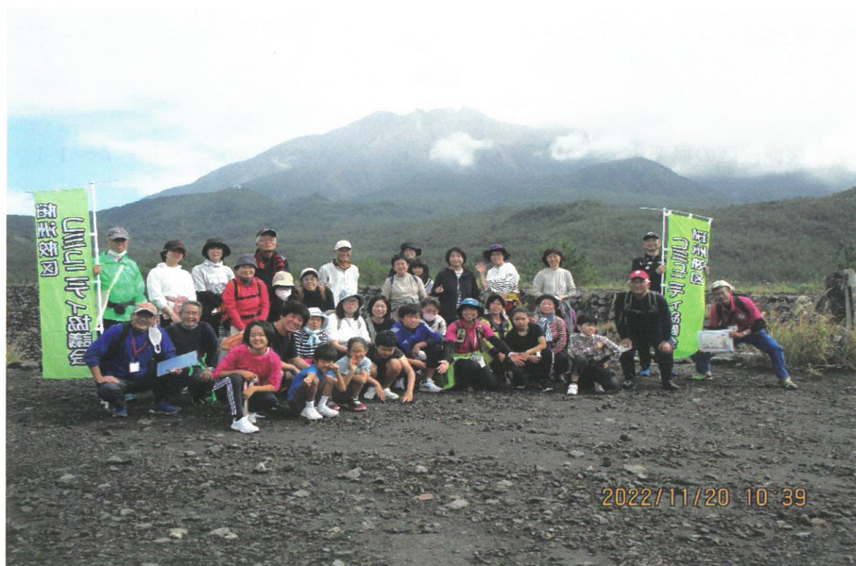
桜島探しウォーキング大会 (引ノ平川 砂防ダム施設)