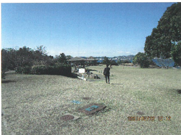
桜島溶岩なぎさ公園 足湯・なぎさ遊歩道