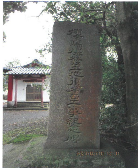
桜島爆発記念碑（桜島武町）