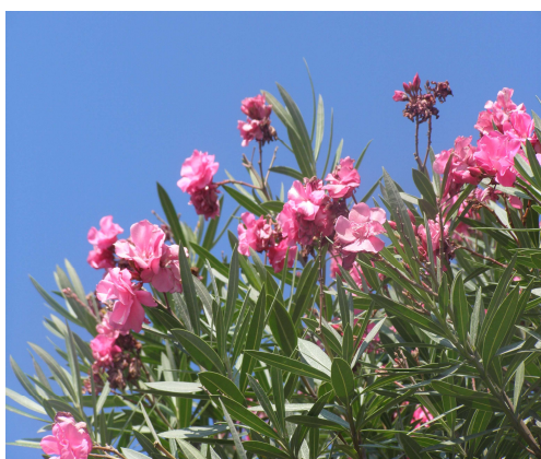
市の花 きょうちくとう