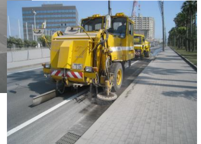
ロードスイーパー