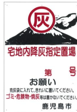
降灰指定置場看板