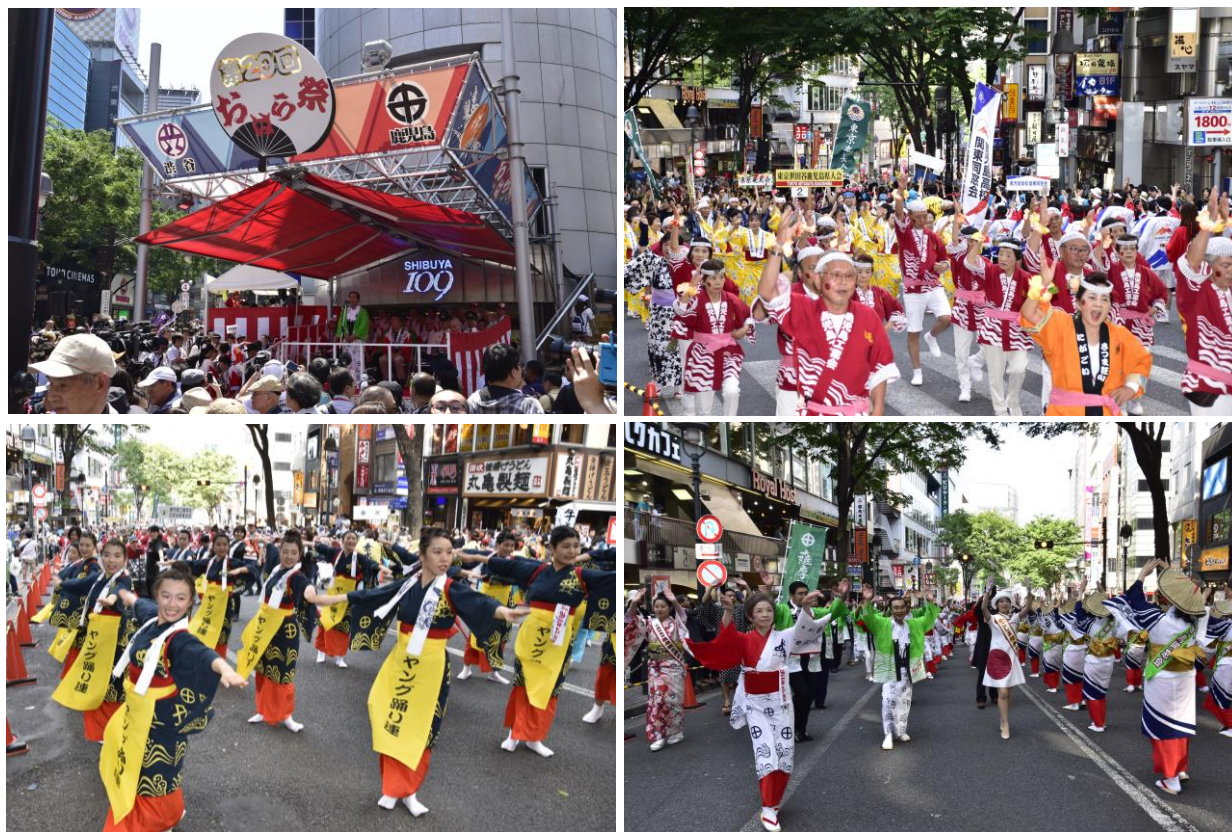
第20回 渋谷・鹿児島おはら祭（東京都渋谷区） — 5月21日(日)開催