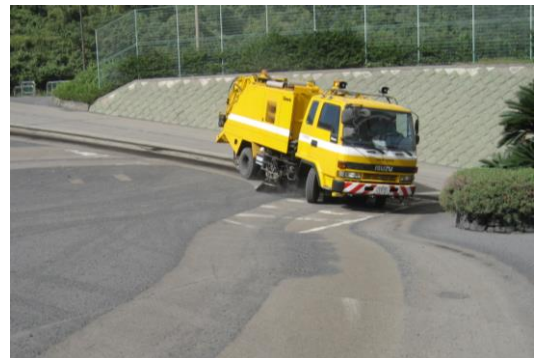
公園内の降灰除去作業の様子