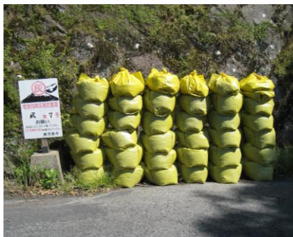
置場に搬出された降灰