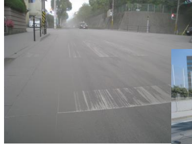
道路に堆積した灰