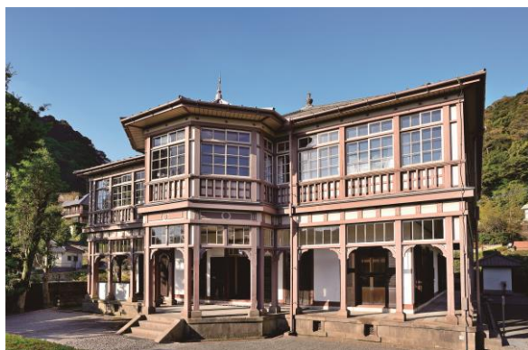
旧集成館（旧鹿児島紡績所技師館）

イベント会場等において展示会を開催するとともに、遺産を紹介するリーフレットなどの印刷物やホームページ等において活用し、遺産を広く国内外にPRする。