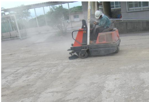
校庭の降灰除去作業の様子