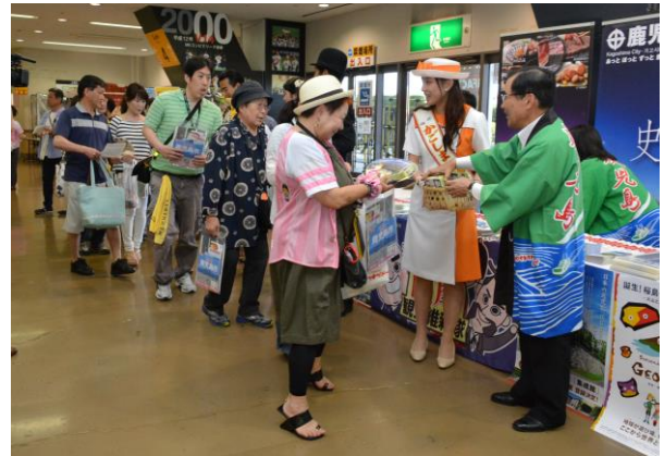
昨年の「鹿児島デー」の様子