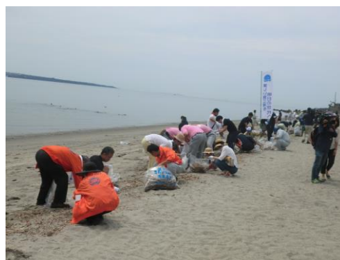
昨年度の磯海水浴場清掃の様子