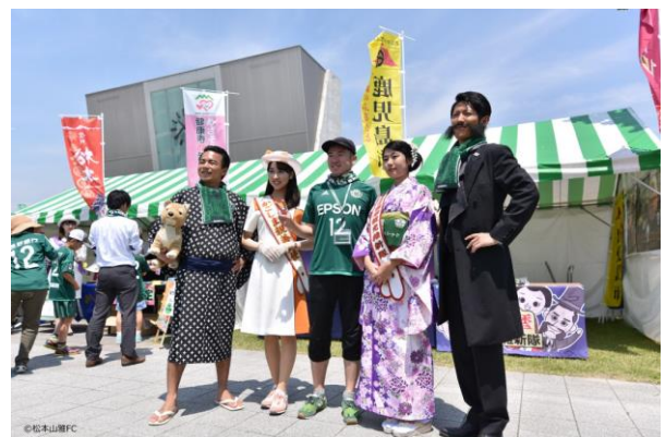
昨年の「松本市・鹿児島市 文化・観光交流都市デー」の様子