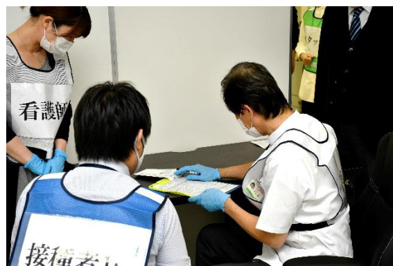
新型コロナウイルスワクチン集団接種シミュレーション（令和3年4月13日）