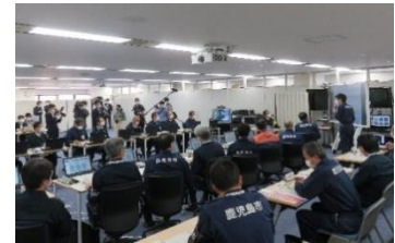
昨年の災害対策本部設置訓練