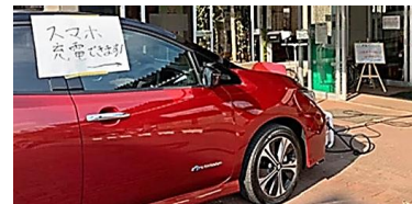
過去の災害時における支援の様子

協定締結式 1月18日（火）11時10分～ 協定の内容 電気自動車及び外部給電器の貸与 店舗への携帯電話等の充電ポイント設置 (市内7店舗) 防災訓練・イベント等への参加