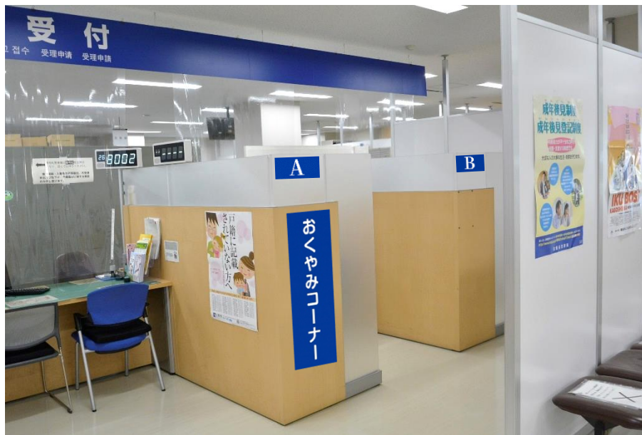
おくやみコーナー窓口のイメージ