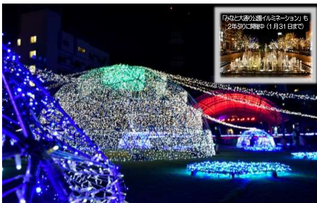
“天文館ミリオネーション2023” & “グルメスタンプラリー” 開催中（1月15日まで）