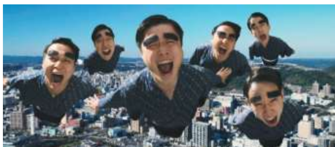
今回も鹿実男子新体操部が出演