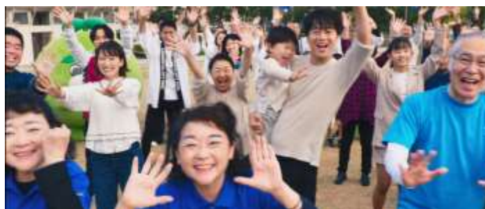
多くの市民エキストラ