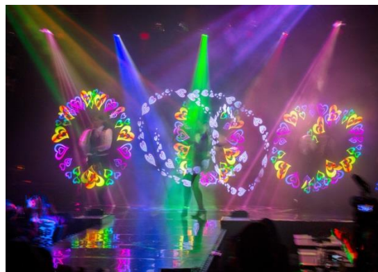
「POI LAB」のパフォーマンス