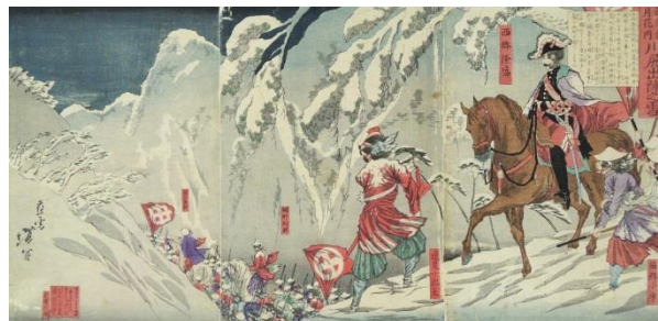
月岡芳年《西南雪月花内 川尻出陣之雪》明治10年9月12日届