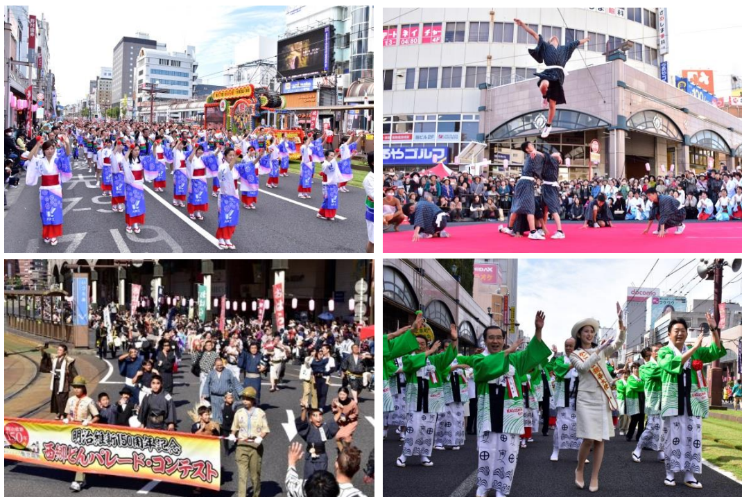
明治維新150周年記念 第67回おはら祭（11月3日）