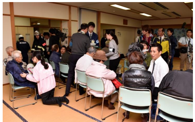
昨年度の島内避難訓練の様子