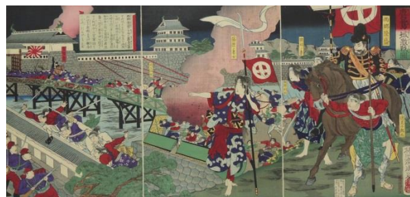
楊洲周延《鹿兒島城激戦ノ図》明治10年9月12日届