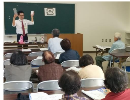
住民説明会の様子

平成28年 5月 鹿児島市清掃事業審議会答申 7月 市民一人1日あたりの家庭ごみの量の目標値（470g）を設定 10月～ 住民説明会の実施（193回） 29年10月 金属類分別収集に係る住民説明会の実施（747回） ～12月 30年 1月 金属類の分別収集開始