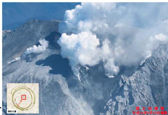
図 御嶽山噴火の様子 (内閣府（防災担当）「平成 26 年 9 月の御嶽山噴火概要」(中央防災会議防災対策実行会議火山防災対策推進ワーキンググループ 第 1 回資料) より)

最近では、平成 26（2014）年の御嶽山噴火による多大な人的被害があり、その後、平成 27（2015）年には口永良部島での初めての噴火警戒レベル 5 の発表と全島避難、桜島の噴火警戒レベル 4 や箱根山火山での噴火警戒レベル 3 への引上げ対応、平成 28（2016）年以降では霧島山、草津白根山等の噴火等、社会的に注目される活発な火山活動が相次いで発生しています。