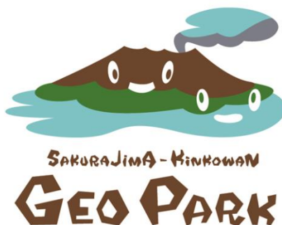
図 桜島・錦江湾ジオパーク ロゴ

これらを踏まえ、第3期鹿児島市観光未来戦略(平成29(2017)年3月策定)の重点施策にも掲げられているとおり、桜島火山そのものを活かした「桜島・錦江湾ジオパーク」、「錦江湾を生かした海の体験」、「まちなか温泉」や、桜島にちなんだ農林水産物も活かした「食の都 鹿児島づくり」、「グリーン・ツーリズム」等、多角的な視点で桜島の資源や恵みを活用し、交流人口の拡大と地域活性化に取り組んでいます。