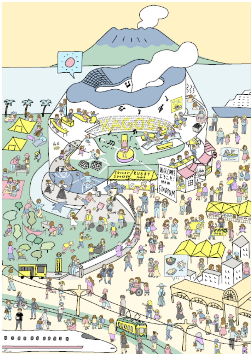
◆多機能複合型スタジアム検討ワークショップ 各グループの案をまとめたパネル