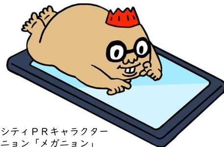
マグシティPRキャラクター マグニオン「メガニオン」