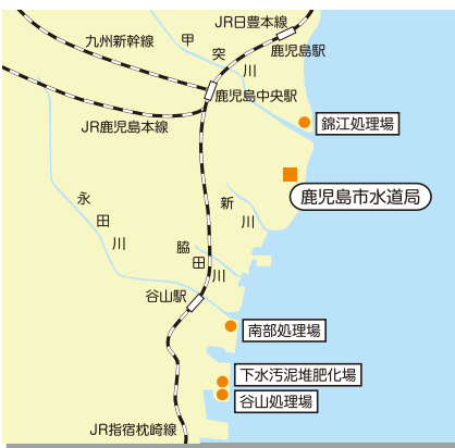
下水処理場等 (平成27年度末現在)

また、現在、南部処理場や谷山処理場などで水処理を行っていますが、今後の更新費用の縮減や維持管理の効率化を図るため、老朽化し、規模の小さい処理場を順次廃止し、平成33年度を目標に、南部処理場と谷山処理場の2処理場に統合することとしています。