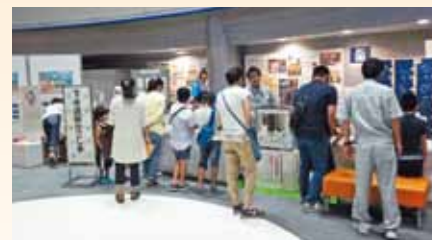
パネルの展示 （左写真）