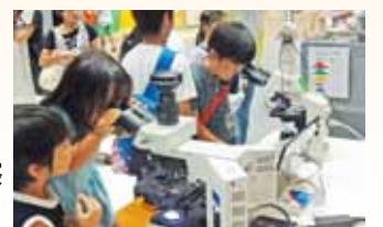
微生物の顕微鏡観察 （右写真）