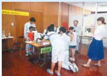
微生物の顕微鏡観察