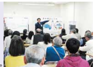
水道モニター会議の様子