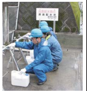
応急給水拠点での→ 応急給水の様子

災害時における応急給水を迅速かつ的確に実施するため、応急給水拠点の利便性や配置状況等の検証を行い、再編・整備を行います。