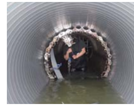
←管更生工法による汚水管の長寿命化対策

処理場の統廃合により処理施設の耐震性の向上を図るとともに、老朽化が進んでいる汚水管路は管更生工法等により耐震化を図ります。