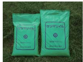
←下水汚泥堆肥（サツマンソイル）

下水汚泥を堆肥化したサツマンソイルの市民利用促進を図るとともに、有効活用を努めます。