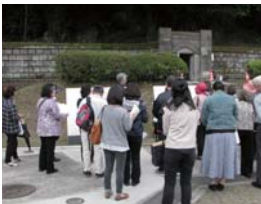
水道モニター会議の様子→ （福昌寺水源池見学）

施設見学会や意見交換会などを通して、使用者のニーズを把握し、事業運営に反映させます。