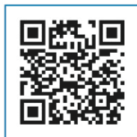
▲ PayB のホームページ ( https://payb.jp/ )

PayBのアプリに登録した金融機関の預貯金口座から即時に引き落としのうえお支払いができるサービスです。 利用可能な金融機関は鹿児島銀行、ゆうちょ銀行、みずほ銀行、三菱UFJ銀行、イオン銀行、じぶん銀行などです。 PayBの詳細についてはPayBのホームページをご覧ください。