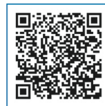
▲ LINE Pay のホームページ ( https://line.me/ja/pay/ )

LINEのアプリにコンビニエンスストアでの振り込みや銀行口座からの振り替えなどによりお金をチャージしておけば、即時にお支払いができるサービスです。 LINE Payの詳細についてはLINE Payのホームページをご覧ください。