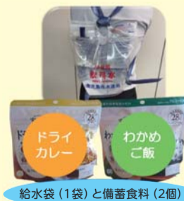
給水袋(1袋)と備蓄食料(2個)