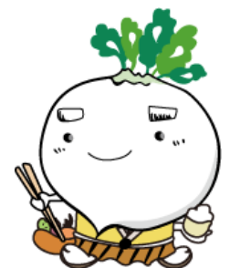
鹿児島市食育推進キャラクター でこん丸